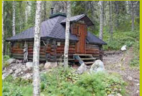
Goados WGS84 67° 42.679' 24° 19.823'