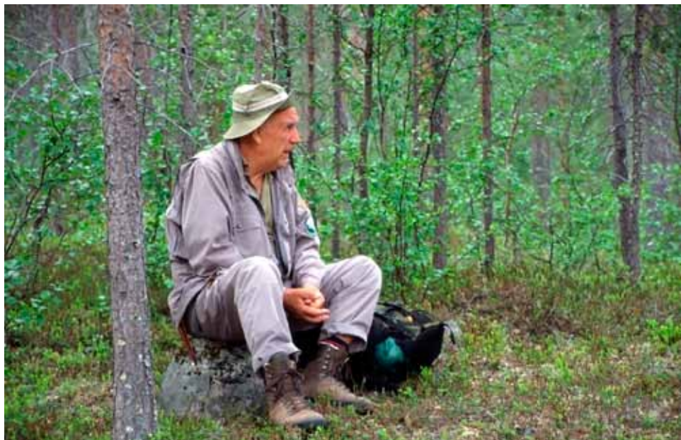
Simo Kiertämäjärven talkoissa UKK-puistossa 2004