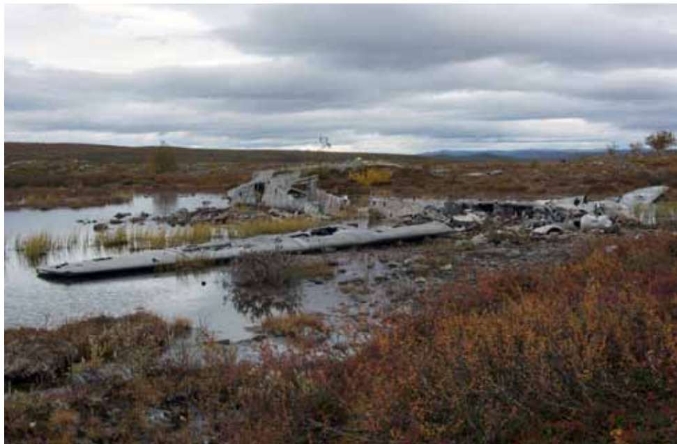
Lapin sodassa tuhoutunut saksalaiskone makaa tunturilammessa.