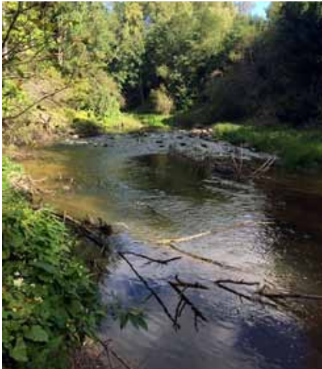
Rajakoskelta, hämmästyttävän kirkasta vettä hiesupohjaisessa suvannossa.

Rajakoski on pieni virtapaikka, jonka pohja vaikuttaa hiesumaiselta isompien kivien välissä. Näin kesäai-