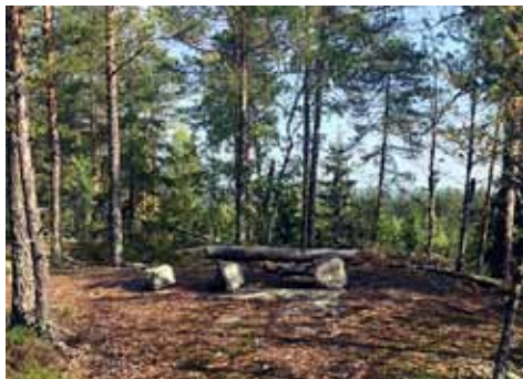
Sudenkallion lepopenkki, ainoa jäännös kolmiomittaustornista.

vasenta laittaa kulkee traktoriura. Pellon pohjoisimmasta kulmasta avautuu väylä metsäpolulle (jos pelto on viljelyksessä, täytyy erkaantua tiestä jo metsätaipaleella ja jatkaa hakkuuaukean läpi samaa metsäpolkua), polkua edetessä törmätään hakkuuaukkoon ja etelään johtavaan kulku-uraan. Jatketaan kuitenkin itään ja nouseaan kallioiden väliseen notkelmaan, josta lähtee vasemmalle (pohjoiseen) helppo polku Sudenkallion huipuille. Polulla kohdataan heti rautakiinnikkeitä kalliissa ja laudanjäänteitä sekä niistä tehty lepopenkki. Nämä ovat muistoja entisestä kolmiomittaustornista, joka toimi sodan aikana myös ilmavalvontatornina. Paikalla päivystivät tuolloin