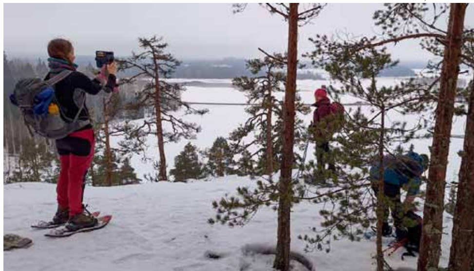
Jaanankallion reunalta avautuu komeat näkymät ympäristöön.

Onkohan retkeilijöistä tullut vähemmän säänkestäviä, sillä 13 asteen pakkasessa meitä oli vain kolme Airin seurana? Kato oli vielä suurempi 23.2. Klaukkalan kuutamoretkellä. Mukaan uskaltautui vain yksi lähtijä. Luvasa oli ollut vesisadetta, jota ei sitten