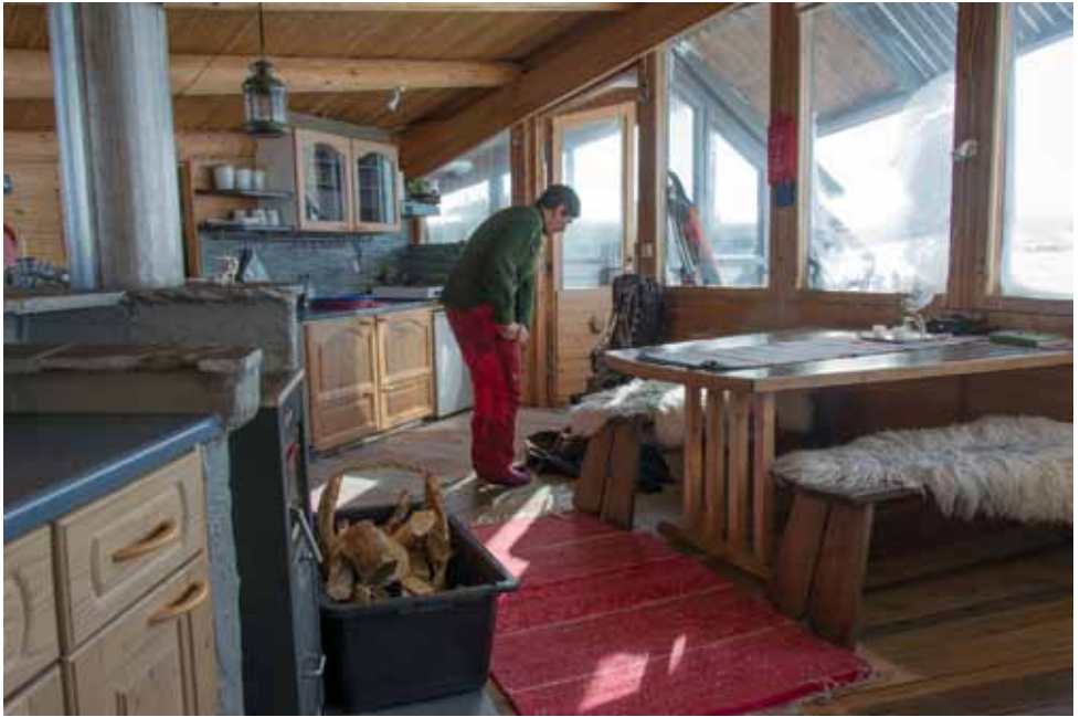
Hillagammin toisessa päässä on hyvin varustettu keittiö ja sen takana toinen makuualkovi. Ovi vie ulkoeteiseen ja ikkunoiden edessä sijaitsee terassi.