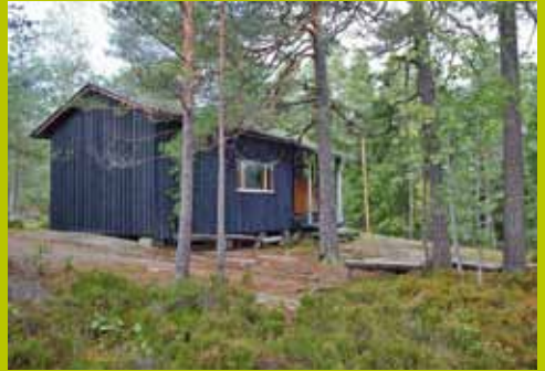
Karjakaivon ylämaja WGS84 60° 17.873' 24° 35.004'