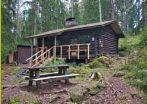
Karjakaivon alamaja WGS84 60° 17.911' 24° 35.090'