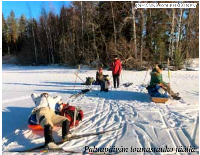
Paluupäivän lounastauko jäällä

Tuuli oli hiukan noussut, joten pysähdyimme lounastamaan Liesjärven suojaisaan lahdelmaan, jonka viereiseen pikkusaareen kalasääski oli rakentanut valtavan pesän. Nautimme lounastauolla hyvästä olost, jonka hiihto, auringon lämpö, ulkoilma, uudet kokemukset ja mukava seura saavat ihmisessä aikaan. Liesjärven retken talletamme mielissämme hyvien retkimuistojen kokoelmaan, josta poimimme sen esiin aina, kun veri