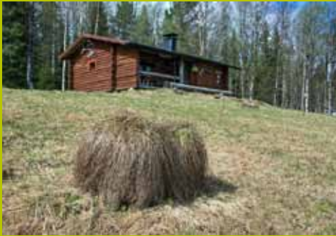
Kukasmaja WGS84 67° 42.708' 24° 19.830'