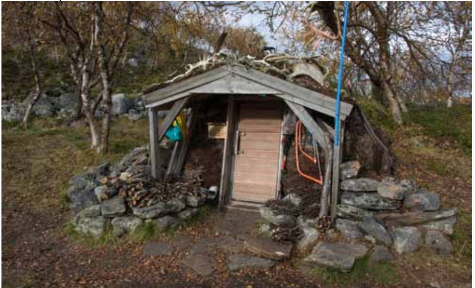
Aadolfin kammi on tavattoman sympaattinen asumus.

Kesällä 1967 Kallio ehdotti opiskelijapojille pientä puhdetyötä, kammin rakentamista ”Kevon itäiseksi haarakonttoriksi”. Metsähallitus vuok-