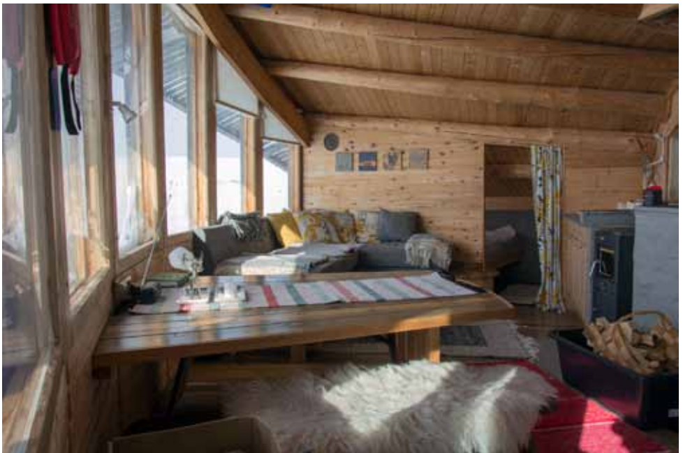
Toinen makuualkovi näkyy sohvoryhmän seinän takana.